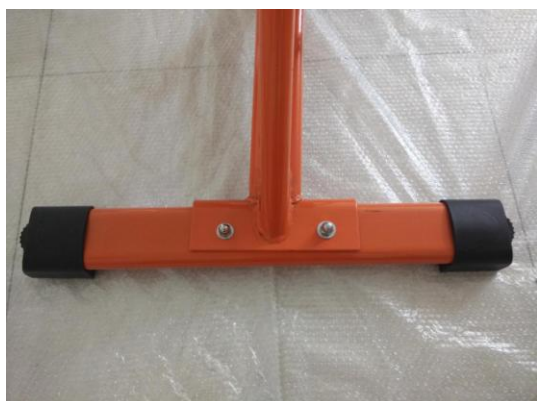
Соединение заднего стабилизатора

Шаг 1: Используя 1 комплект крепежа (d), прикрепите задний стабилизатор "2" к основному корпусу . Таким же образом прикрепите передний стабилизатор "1" к основному корпусу .