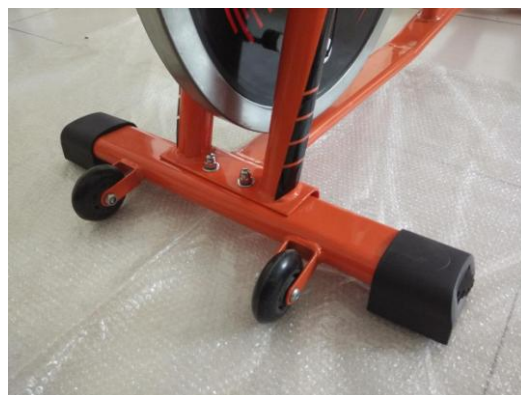
Соединение переднего стабилизатора

Шаг 2: Прикрепите сиденье к основному корпусу .